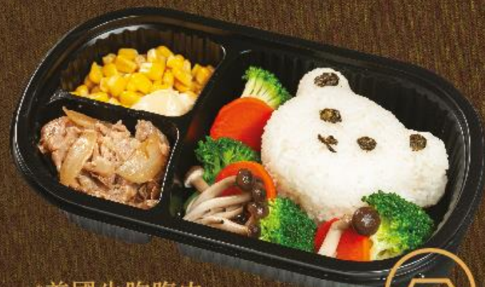
*美國牛胸腹肉 野菜粟米小熊飯 *Rice with US Short Rib, Vegetables and Sweet Corn