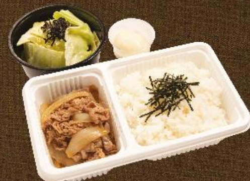
壽喜燒牛肉飯/壽喜燒丹麥豚肉飯 配塩醬麻香椰菜 Rice with Half Boiled Egg & Sukiyaki Beef / Rice with Half Boiled Egg & Sukiyaki Danish Pork (Served with Salted Cabbage Salad)