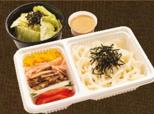
麻醬冷烏冬 配塩醬麻香椰菜 Cold Udon in Sesame Sauce (Served with Salted Cabbage Salad)