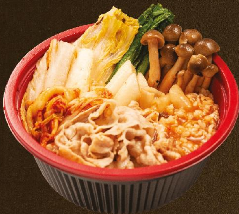
泡菜年糕條丹麥豚腩肉 野菜番茄湯飯 Danish Pork Belly, Vegetables, Kimchi and Toppoki (Korean Rice Cake) Rice in Tomato Soup