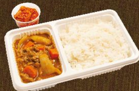
咖喱牛肉飯 配是日前菜 Beef Curry Rice (Served with Appetizer of the day)