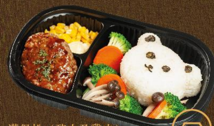
漢堡扒 (豬肉及雞肉) 野菜粟米小熊飯 Rice with Burger Steak (Pork & Chicken), Vegetables and Sweet Corn

【可轉配三文魚小熊飯 Can be changed to Shredded Salmon Rice】